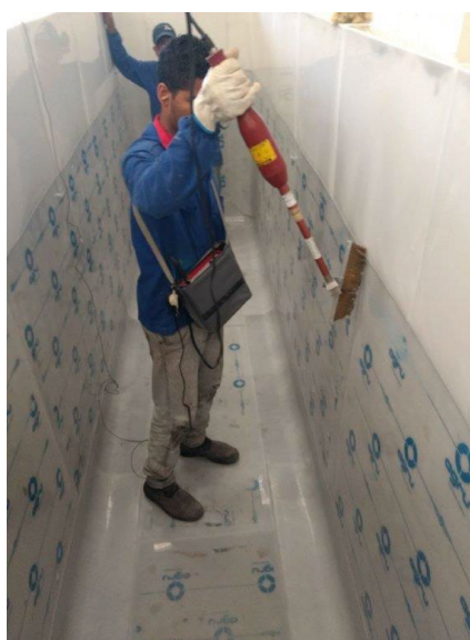
Execução do "spark test" para garantir 100% de estanqueidade